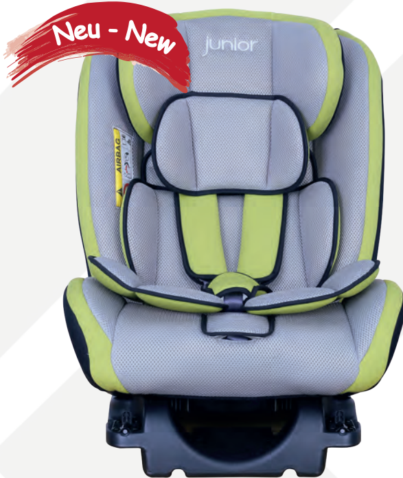
Design 1142 44441013

ECE R44/04 SEMI-UNIVERSAL 0-13kg Y UNIVERSAL 9-18kg Y SEMI-UNIVERSAL 15-36kg E8 048916 GROUP 0+,I,II,III WORLDWIDE