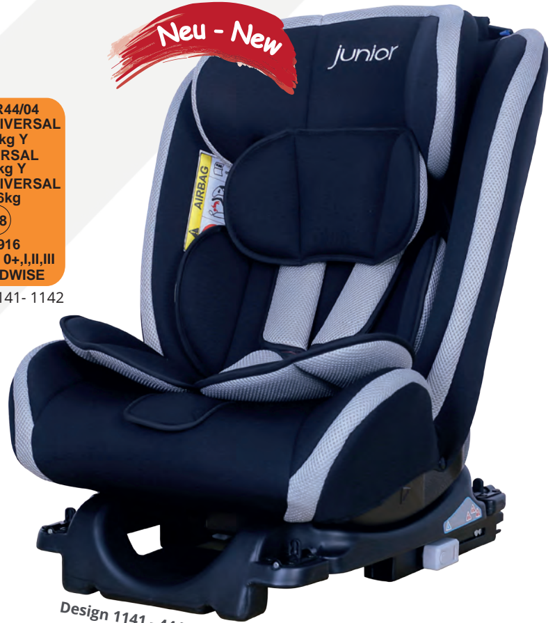
Design 1141 - 44441018