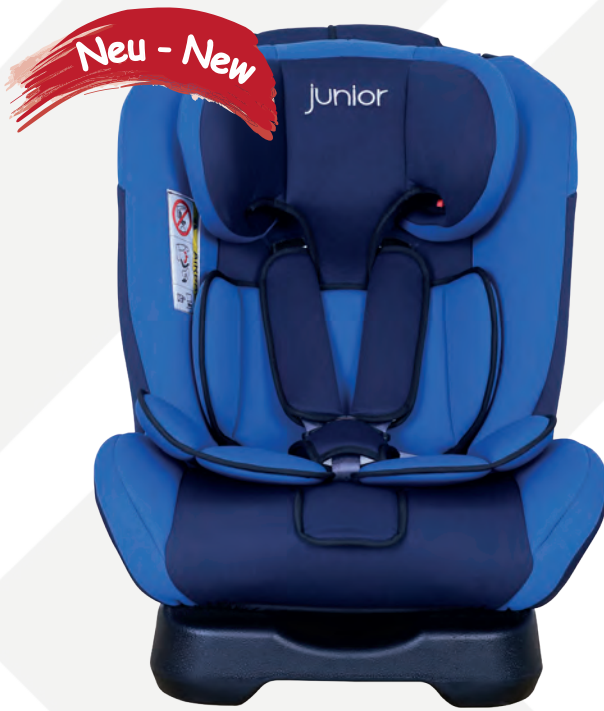
Design 1041 - 44440905