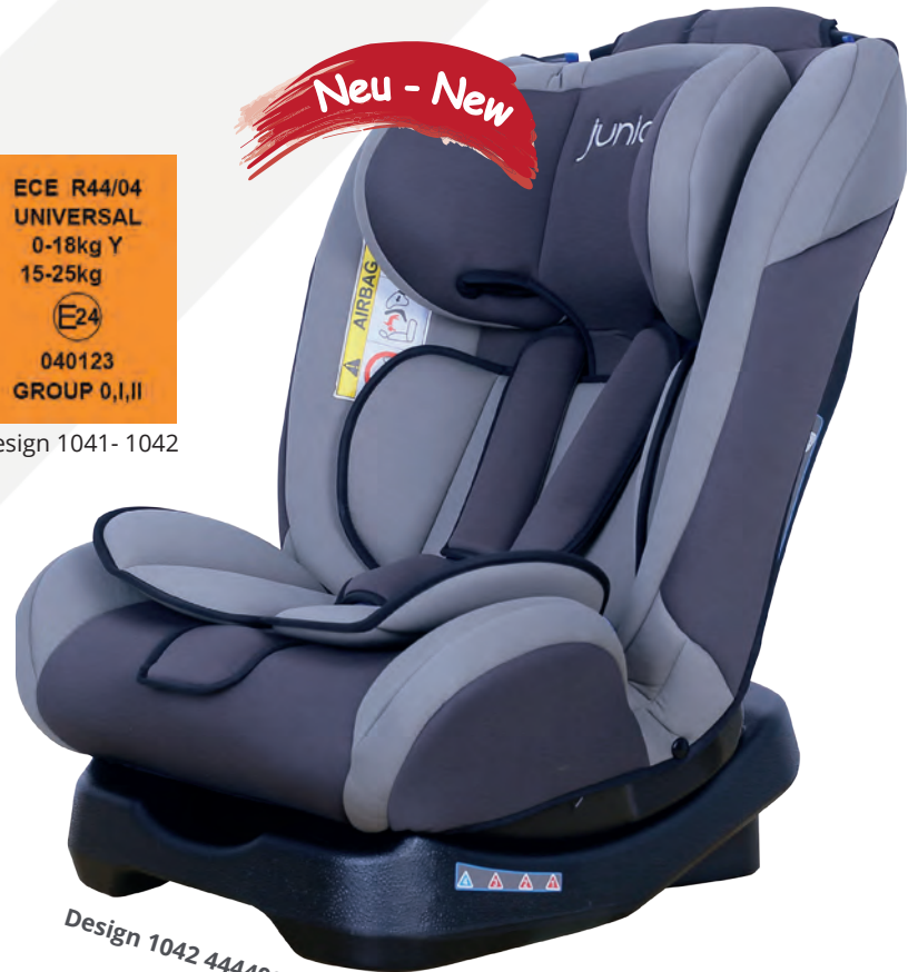
Design 1042 44440918